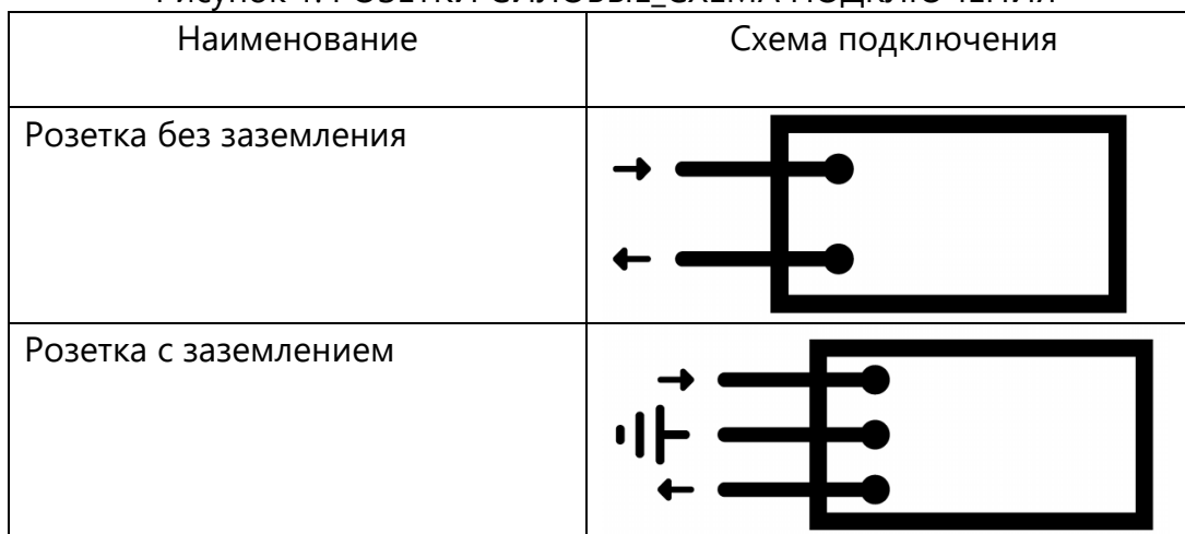
Рисунок 1. РОЗЕТКИ СИЛОВЫЕ_СХЕМА ПОДКЛЮЧЕНИЯ