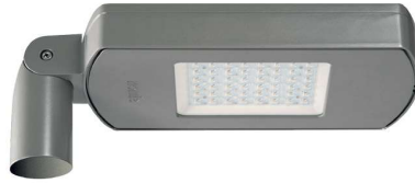
ALTAIR IXF LED